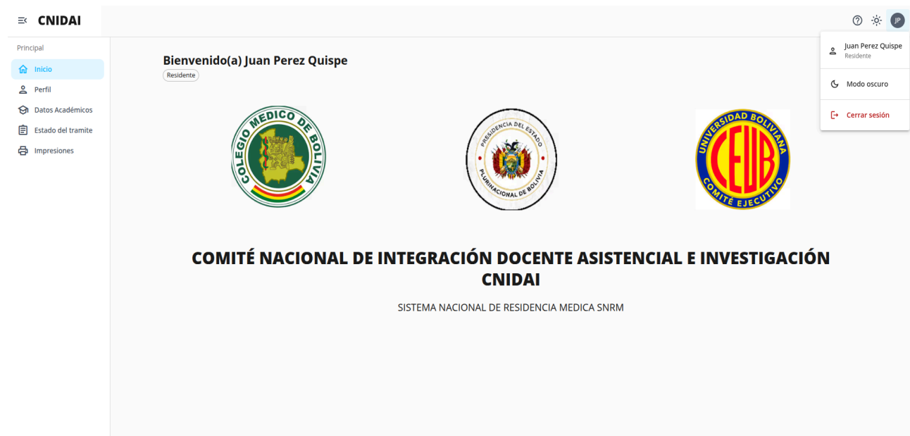
Imagen 5: Inicio del sistema