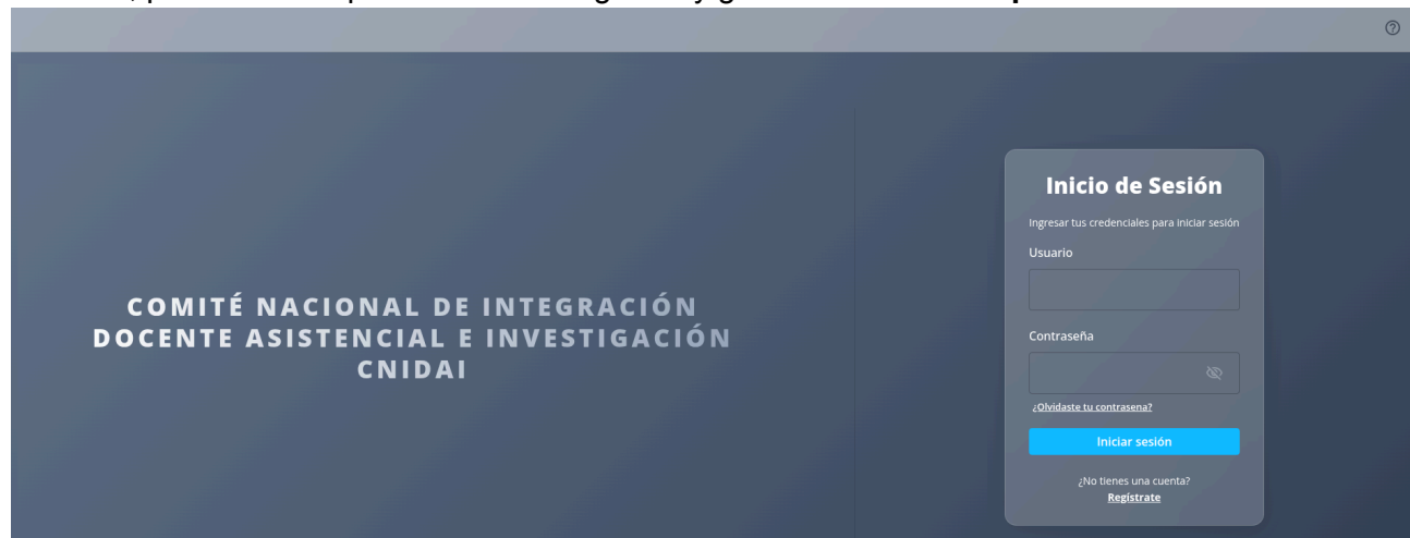
Imagen 1 Login Público para inicio de sesión

intuitiva , permitiéndole posteriormente ingresar y gestionar sus datos personales .