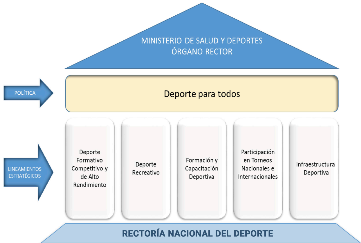
Figura N° 3. Políticas y Lineamientos Estratégicos