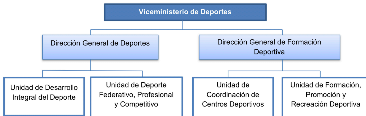
Figura N° 2. Estructura del Viceministerio de Deportes